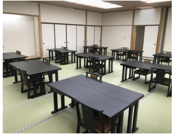
宴会場は換気の徹底と間隔を空けて対応