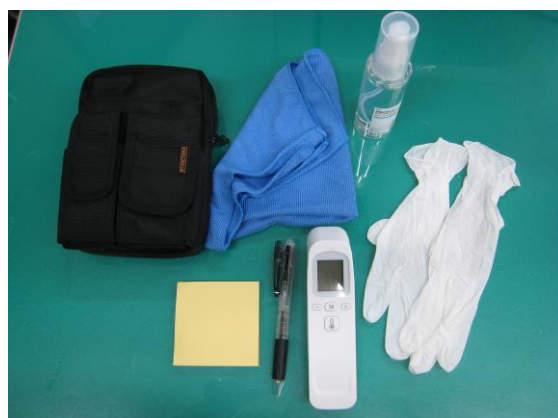
スタッフが携帯する清掃グッズ

館内は午前午後時間を決め、パブリックスペースの手すりやドアノブ等、接触多い場所を重点的にアルコールで消毒を実施しております。