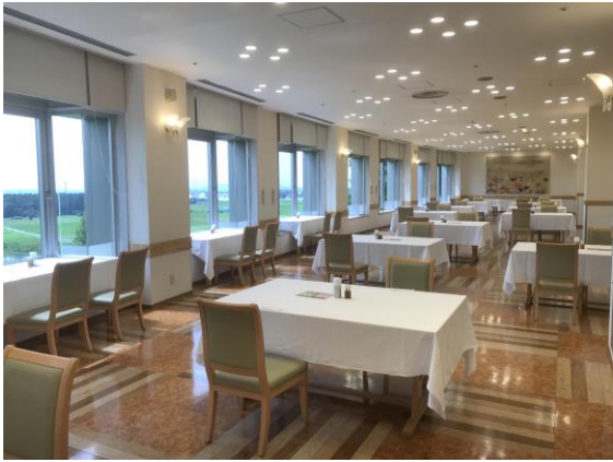
レストランは対面を避けてレイアウト