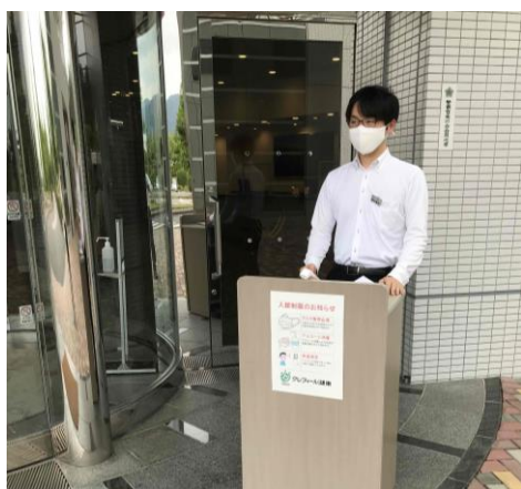
玄関前での検温・マスク着用・体調確認

またレストラン、研修会議、至福の湯、交通研修等各所にアルコール消毒液を設置し手指消毒をお願いしております。