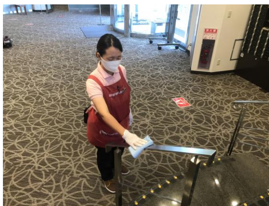
1階ロビー階段の手すり。定期的に消毒

クレフィール湖東で使用するアルコール消毒液は全てアルコール濃度 75%以上を基準とした消毒液を使用しております。各スタッフが消毒セットを携帯し、頻繁にお客様の触れる場所をこまめに拭き取りをしております。