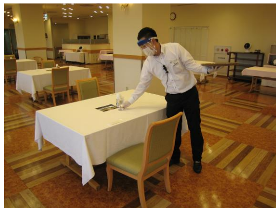
レストランも感染予防対策を行っています