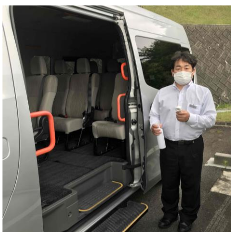
送迎バス乗車前での検温・マスク着用・体調確認