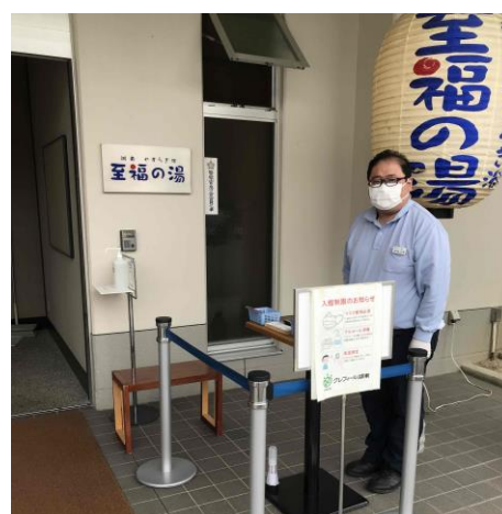
至福の湯玄関前での検温・マスク着用・体調確認