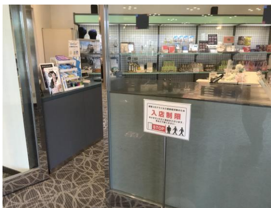
売店では入店の人数制限を実施

ホテル内で密集・密接になりそうな箇所には、立ち位置の表示や入場制限を設けております。 また、至福の湯では、ご利用時間1時間までの制限や同時に入浴可能な人数を男女各10名にするなど、密集・密接を避ける取組を実施しております。