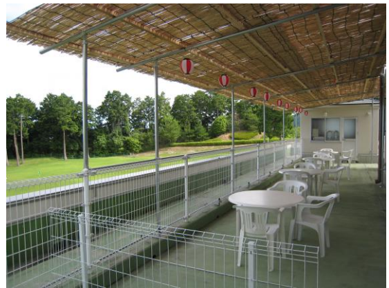
密集回避なら2階のクレコテラスで