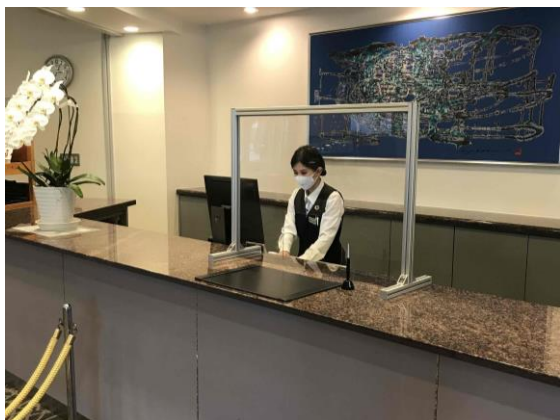
フロントスタッフもマスク・手袋を着用

マスク着用、手洗いと手指消毒、出勤時の検温チェック、接客時のフェイスシールド・衛生手袋の装着・カウンターの透明シールド設置等、感染拡大防止の対策に努めております。