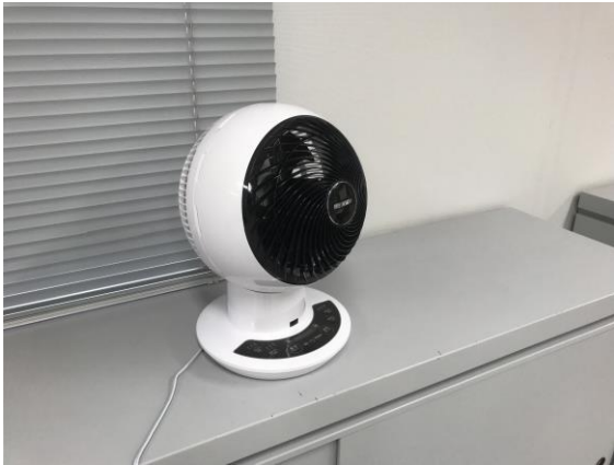
宴会場や会議室に設置のサーキュレーター