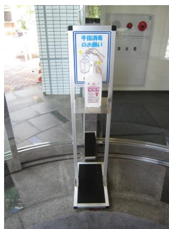
各所にアルコール消毒液設置